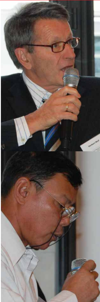
Von oben nach unten: Herbert Wulf, Tun Channareth

Zu Beginn der 1. Session führte der Friedens- und Konfliktforscher Herbert Wulf in die Thematik des Panels ein und betonte, dass Abrüstung ein Gebot der humanitären Verantwortung für andere Menschen sei, die auf dem Gedanken der Menschenrechte gründen sollte. Wulf unterstrich, dass mit dem Abkommen von Ottawa Verhandlungen erstmals nicht hinter verschlossenen Türen stattfanden, sondern öffentliche Akteure mit einbezogen wurden. Dies sei eine Konsequenz aus der Einsicht, dass der moderne Krieg in größerem Umfang als je zuvor zivile Opfer produziere und dem Schutz der Zivilbevölkerung mehr Engagement entgegen gebracht werden müsse.